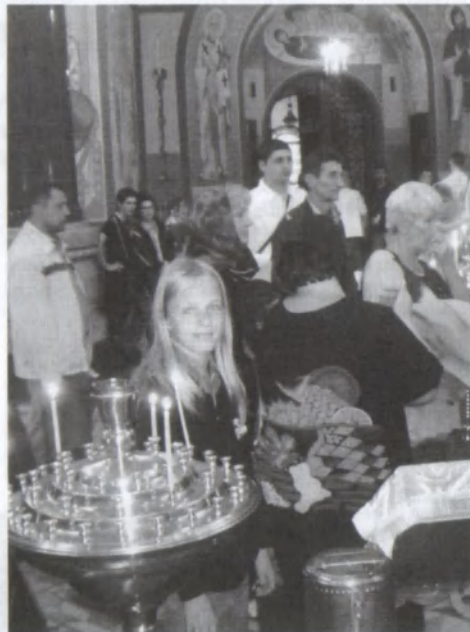
Naši poutníci uvnitř chrámu

ného centra se v úzké uličce nachází nejstarší pravoslavný chrám ve Vídni, jedná se o katedrálu svaté Trojice v jurisdikci konstantinopolského patriarchátu. Krásný byzantský chrám nás přivítal svoji duchovní atmosférou a nám bylo umožněno v tomto sídelním chrámu rakouského metropolitě zazpívat několik našich liturgických písní. Naší další zastávkou bylo zastavení u sídla rumunské církevní obce; zajímavé je, že tato domovní kaple se nachází v rezidenci, kterou sdílí několik zahraničních ambasád.