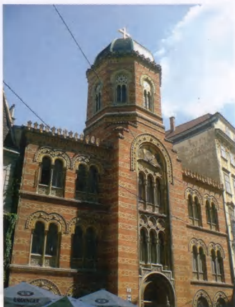
Katedrální chrám sv. Trojice