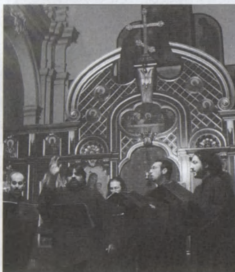
Soubor Psaltikis diakoni z Athén

Třetí koncert byl zasvěcen duchovní vokální hudbě ruského romantismu. Pod titulem Romantismus a pra-