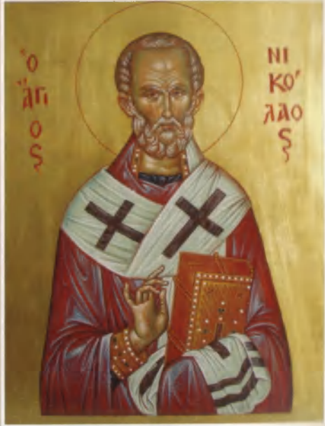
Dimitrios Bozinis, vice na straně č. 33