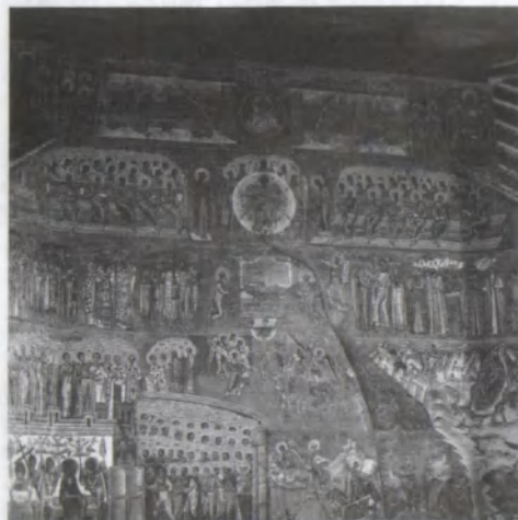
„Sixtinská kaple Východu“ Monastýr Voronec, Rumunsko

kanova díla a osobního vývoje se staršími autory a díly, například německého liberálního protestanta Adolfa von Harnacka, který ovlivnil racionalisticky smýšlející věřící například v Církvi československé, nebo také u nás dobře známého, vlivného evangelického profesora Josefa L. Hromádky „Křesťanství v myšlení a životě. Pokus o výklad