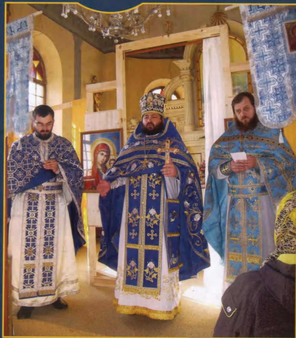
TRAPENÍ A SMUTEK, MÍKA A JEHO MODLA. PAVEL FLORENSKIJ, SŮL ZEMĚ