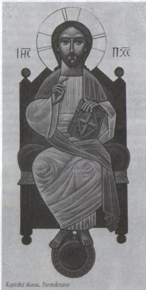
Koptská ikona, Pantokrator