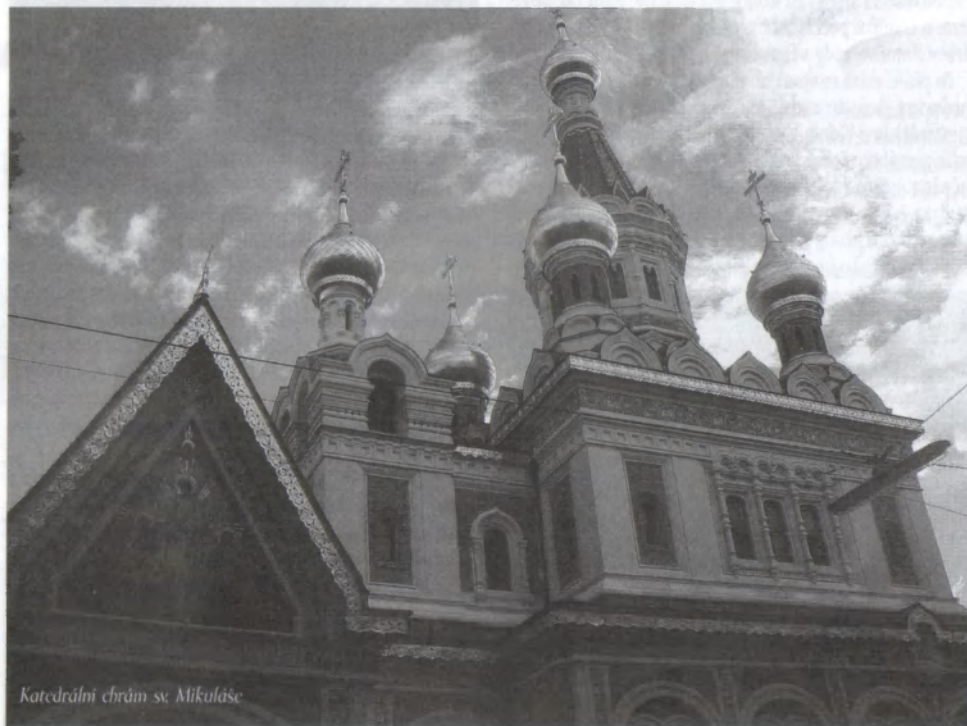
Katedrální chrám sv. Mikuláše

Svatou liturgii jsme sloužili s několika duchovními, na velmi vysoké úrovni zpíval chrámový pěvecký sbor a za zajímavou zmínku ještě stojí, že mezi duchovními je napr.