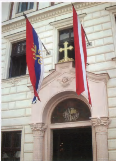
Chrám sv. Sávy