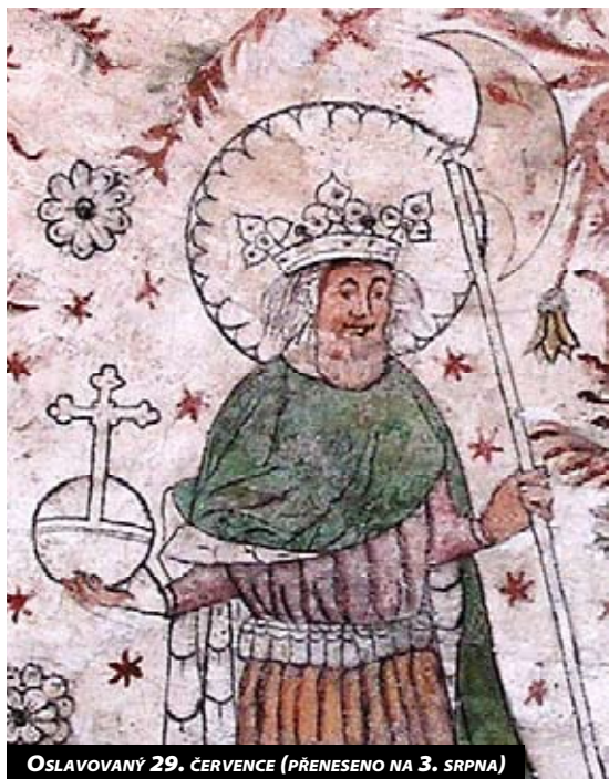
OSLAVOVANÝ 29. ČERVENCE (PŘENESENO NA 3. SRPNA)

Neporušenost Olafova těla byla potvrzena jeho věrným biskupem Grimkelem, jehož sídlem byl Nidaros (Trondheim). Jak čteme v Sáze sv. Olafa: „Biskup Grimkel se šel setkat s Tambarskelverem, který ho ochotně přivítal. Následně hovořili o mnoha věcech a zvláště o velkých událostech, které se odehrály v jejich zemi. Shodli se mezi sebou ve všech záležitostech. Biskup nato vyšel na trh a celý dav ho přivítal. Starostlivě se vyptal na zázraky, které se týkaly krále Olafa, a zjistil mnohé těmito otázkami. Potom biskup poslal zprávu Torgilsovi a jeho synovi Grimovi do Stiklastadu, vyzývající je, aby se k nim připojili ve městě. Torgils a jeho syn biskupovi dosvědčili všechny mimořádné věci, které znali, a taktéž mu řekli o místě, kde ukryli královo tělo. Biskup poté poslal zprávu Einarovi Tambarskelverovi a požádal krále, aby jim dovolil vyzdvihnout tělo krále Olafa ze země. Král dal svolení a řekl biskupovi, ať koná tak, jak chtěl. Nato se ve