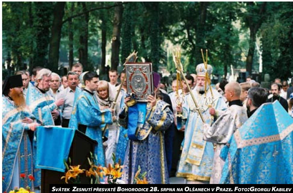
SVÁTEK ZESNUTÍ PŘESVATÉ BOHORODICE 28. SRPNA NA OLŠANECH V PRAZE. FOTO: GEORGIJ KABILEV

Osvobod' me se z pout nenávisťi, která nám neumožňuje vidět skutečný běh událostí, a postavme hradby z lásky.