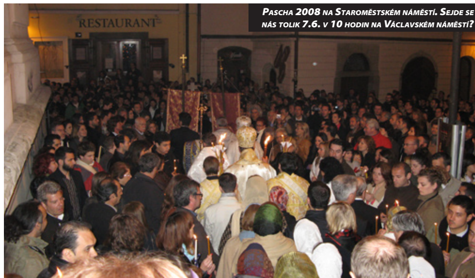
PASCHA 2008 NA STAROMĚSTSKÉM NÁMĚSTÍ. SEJDE SE NÁS TOLIK 7.6. V 10 HODIN NA VÁCLAVSKÉM NÁMĚSTÍ?

PRAHA. Na zasedání vlády České republiky 23. ledna 2008 byl schválen text věcného záměru zákona „O nápravě některých majetkových křivd způsobených církvím a náboženským společenstvem v době nesvobody a o narovnání vztahu mezi státem a církvemi a náboženskými společnostmi“. Souhlas s textem věcného záměru zákona vyslovila již na sklonku loňského roku jak vládní komise, tak všech 17 církví registrovaných v České republice, jichž se problematika dotýká. Základním principem řešení bude kombinace finanční náhrady za majetek, který nebude vydán, a naturální restituce, tj. faktické vydání majetku. Řeholním řádům a kongregacím bude umožněna naturální restituce majetku, jehož vlastníky byly a který drží stát z doby po 25. únoru 1948. U církví a náboženských společností se bude postupovat cestou paušální finanční náhrady, jež bude zahrnovat odškodnění za majetek, který nebude vydán. Celková suma, kterou bude stát v průběhu šedesáti let splácet, je 83 mld. Kč. Tato částka bude úročena 4,85 procenty. Náhrada stanovená zákonem bude vyplácena na základě smluv mezi