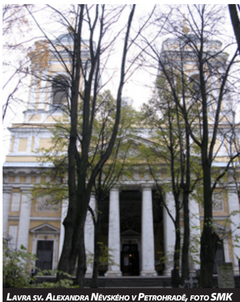
LAVRA SV. ALEXANDRA NĚVSKÉHO V PETROHRADĚ

Brzy však poznal krutost světského života. Jeho otec Jaroslav byl knížetem v Novgorodě – a právě v tomto městě mohl Alexandr nasbírat své první ostruhy „politické moudrosti“. Novgorod byl svobodným městem, které si samo vybíralo svého knížete. Když se jim znelíbil, jednoduše ho poslali, ať si jde svou cestou. V roce 1228 se s Novgorodci nepohodl ani Jaroslav a zanechal zde své dva syny. Město souží hlad a mor. Mrazy zničily ozimy, a tak nešťastní Novgorodci jedí mech a kůru ze stromů, psy, kočky – i vlastní koně. Lidé, šílení hladem, se měnili v divokou zvěř. Jedli těla mrtvých – a zabíjeli i živé. Množí se přepadení, krádeže, požáry... o tom všem barvitě píše letopisec. Hlad vítězí nad strachem z jakéhokoliv trestu.