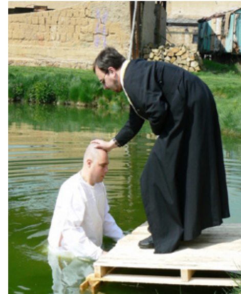
Nenarodí-li se kdo z vody a z Ducha, nemůže vejít do království Božího. (J 3,5)