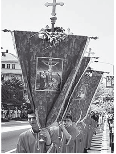
Bělehrad – na Nanebevstopení Páně