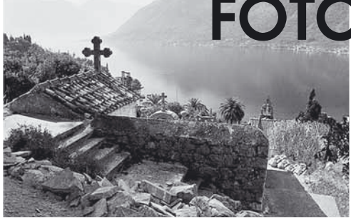
Perast – Boka kotorská, Černá hora