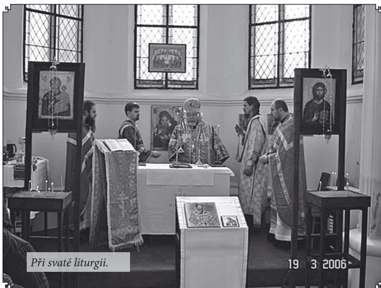
Při svaté liturgii.

Hodonínský chrám je zasvěcen sv. ap. rovnému arcibiskupu moravskému Metodějovi, který je na ikoně, napsané v Soluni, znázor-