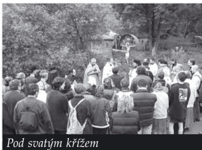
Pod svatým křížem