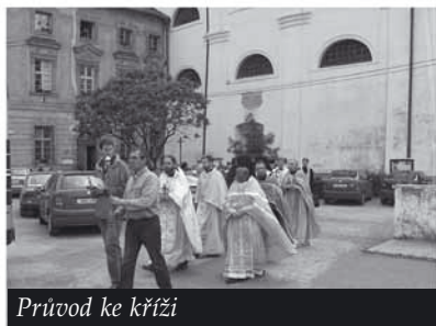
Průvod ke kříži