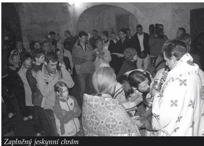
Zaplněný jeskynní chrám