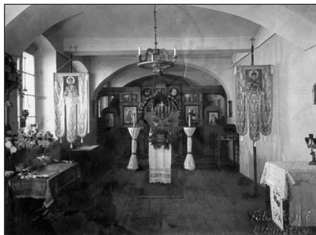
Interiér prvního chrámu v Litoměřicích, 1948. Typická ukázka adaptovaného prostoru.