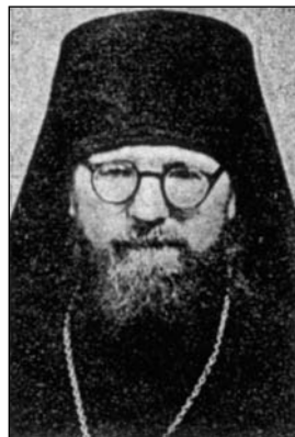
V roce 1947.

V průběhu let 1934-40 pak jeho zásluhou vzniká na Moravě ve Střední Evropě jedinečný soubor pravoslavné architektury ruského stylu.