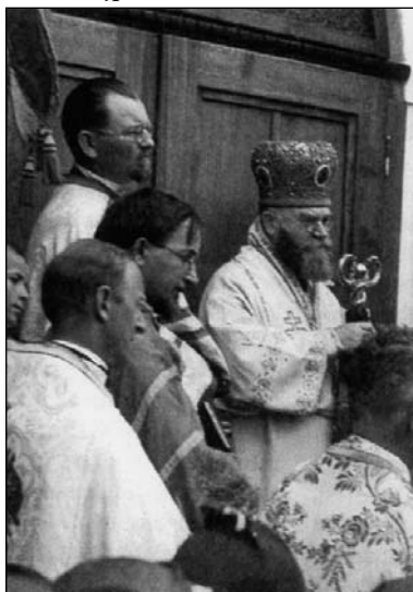
S vladykou Gorazdem při svěcení chrámu v Řimicích na Moravě, 21. května 1934.