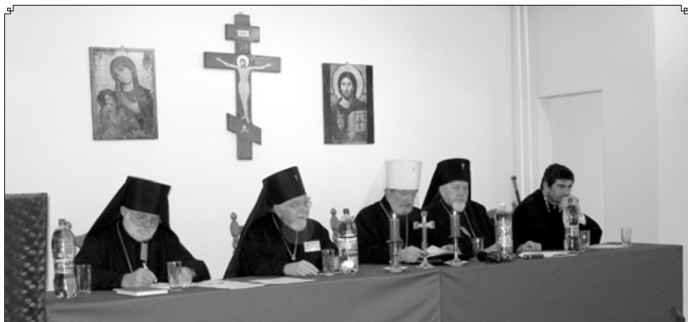
Členové Posvátného synodu