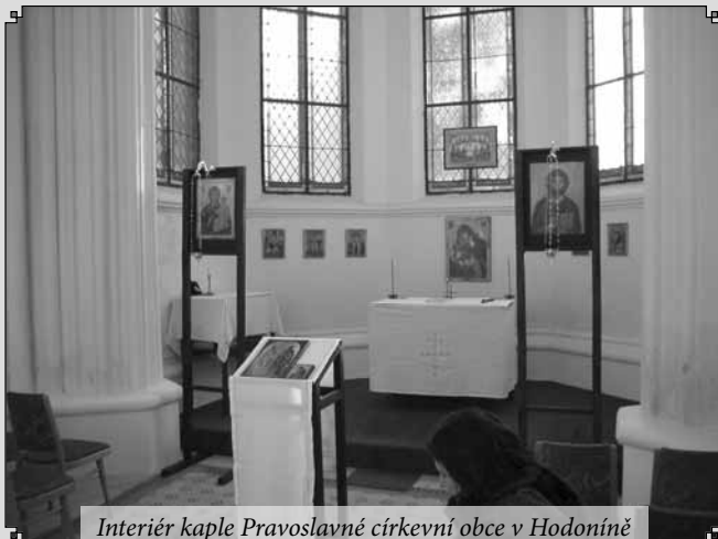
Interiér kaple Pravoslavné církevní obce v Hodoníně