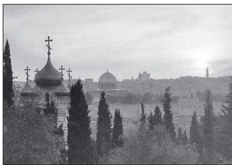
Jeruzalém z hory Olivetské

Svátek Vzkříšení Kristova, před kterým rok co rok dochází k popisované události, je pro křesťany největším svátkem, symbolem vítězství Spasitele nad hříchem a smrtí, počátkem nového, vykoupeného a naším Pánem Ježíšem Kristem posvěceného světa. Zázrak