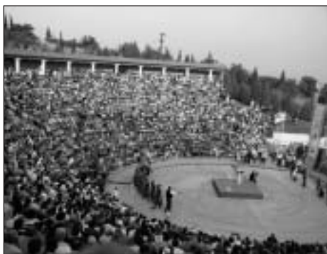
Olympijské hry se staly celonárodním svátkem

Ve dnech 3. 7. až 30. 7. 2004 proběhl v Řecku mezinárodní studijní program, jehož se zúčastilo dvacet pravoslavných křesťanů pražské a brněnské eparchie naší pravoslavné církve.