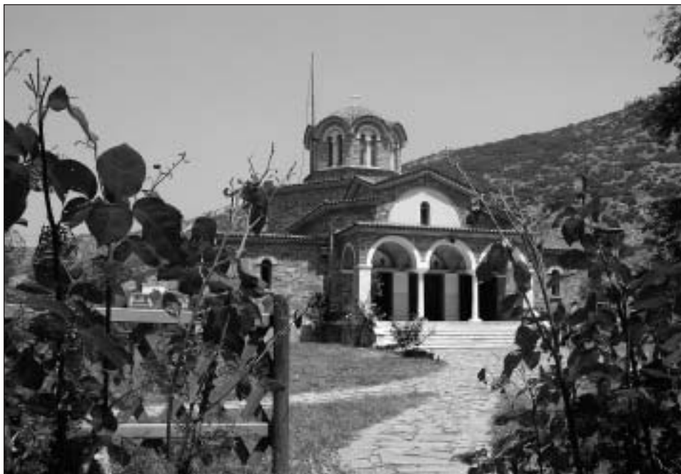
Chrám na místě křtu sv. Lydie

otázky byly opravdovou duchovní posilou a v mnohém i ukazatelem další cesty.