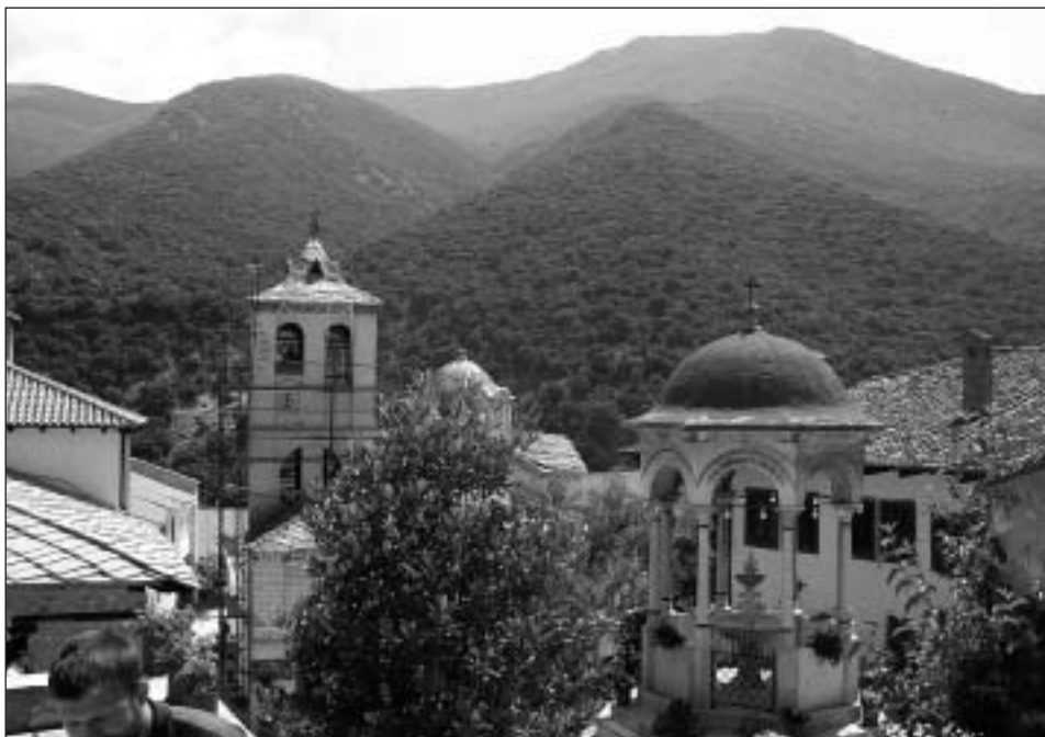
Ženský monastýr sv. Jana Theologa a mlčenlivá krása hor

Mnoho zaparkovaných automobilů má stažená okénka. Můžete spatřit zaparkovaný