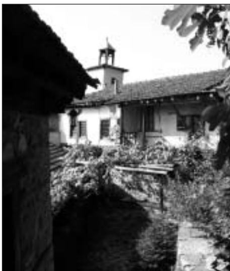
Svatý monastýr Timiu Prodromu

Výuky se ujaly učitelky řeckého jazyka. Všechny patří mezi zkušené pedagogy v ob-