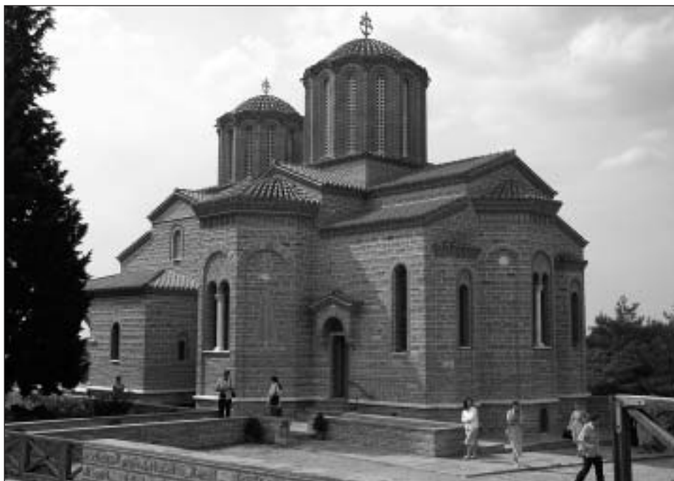
Hlavní chrám monastýru sv. Jana Theologa