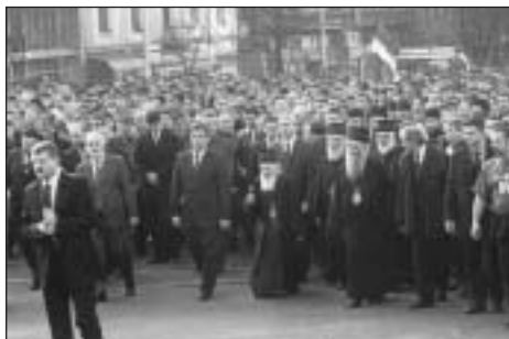
Bělehrad, protestní průvod v čele s patriarchou Pavlem a srbským premiérem V. Koštunicou

Srbský koordinátor pro Kosovo Nebojša Čović mezitím kritizoval „naprostou neschopnost“ NATO chránit Srby v provincii. „Celá koncepce multietnického Kosova se nyní zhroutila,“ řekl doslova. Dnešní největší srážka se odehrála v obci Obilice u kosovského správního stře-