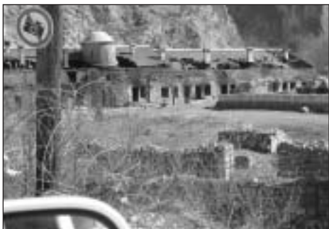
Vypálený monastýr sv. Archandělů.

naš autobus albánské děti házely dělobuchy a bláto, báli jsme se nejhoršího.