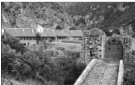
Monastýr sv. Archandělů před vypálením.

Minulý rok na podzim jsem s poutníky z Čech, Moravy a Slovenska navštívil Kosovo a Metochiji. Tehdy v nás zůstal pocit bolesti z rozdělené země a také ze zloby jeho albánských obyvatel, kterou dávali najevo nejen svým spoluobčanům – kosovským Srbům, ale také i nám, jejich přátelům. Když