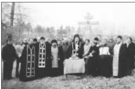
U sv. Kříže vztyčeného u koncentračního tábora pro české Romy v Letech dne 8. 4. 2003