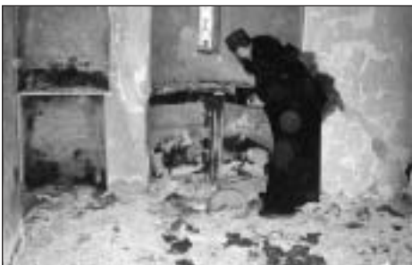
Zničený monastýr sv. Archandělů – bez komentáře.