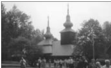
Hospodin požehná dobrému dílu