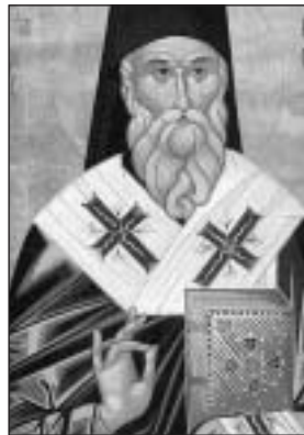
sv. Nektarios Eginský

Zvěst o chlapcově uzdravení se ihned roznesla po celém ostrově. Za vladykou začali přicházet věřící s různými problémy a nemocemi. Jeho uzdravující schopnosti uvěřila také jedna žena, která dlouhá léta trpěla krvácením. Lékaři jí nedokázali pomoci. Rozhodla se, že to udělá tak, jako ona žena v evangeliu. Čekala na jednom místě, až vladyka půjde kolem. Jakmile se tak stalo, přistoupila k němu a políbila lem jeho řízy. V tu chvíli se krvácení zastavilo.