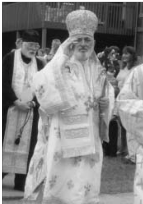
Žehmající vladyka Nicholas při průvodu kolem svěceného chrámu

V neděli započala svatá liturgie v 10.00 hodin za účasti velkého počtu věřících, dále 76 duchovních a 8 hierarchů z různých sester-