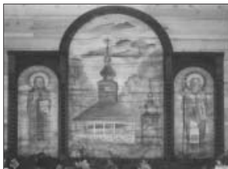
Výzdoba interieru ikony sv. Cyrila a Metoděje