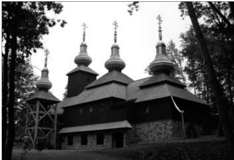
Nově posvěcený dřevěný chrám sv. Cyrila a Metoděje v Camp-Nazareth.