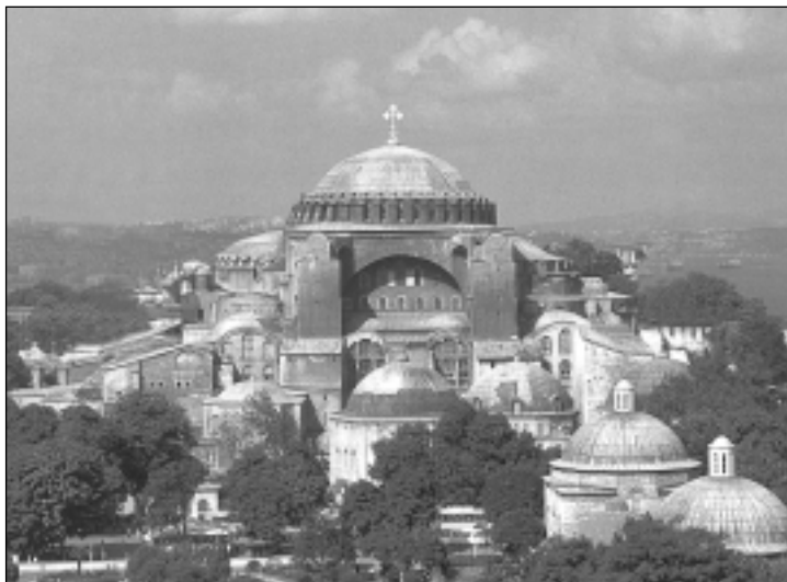
Chrám Hagia Sofia v Konstantinopoli, (redakčně upraveno)

Pravoslavní, uvyklé mluvě symbolů a vycvičené v chápání filosofických pojmů, zahlédá v duchu této knihy Moudrost-Sophii jako opravdovou živoucí bytost, dívku krásnou a přitažlivou. Maluje ji na svých ikonách, většinou s andělskými křídly v podobě žhoucích plamenů, ozařujících i její tvář. Bývá oděna jako archijerej nebo císařovna. Na hlavě má panovnickou korunu a sedí na vladařském trůnu o sedmi nohách, připomínajících sedm sloupů cařihradského chrámu a biblický výrok: „Moudrost si vystavěla dům, vytesala sedm sloupů“. (Přís 9,1) Nad Sophií se vznášá Spasitel se symboly čtyř evangelistů a andělé