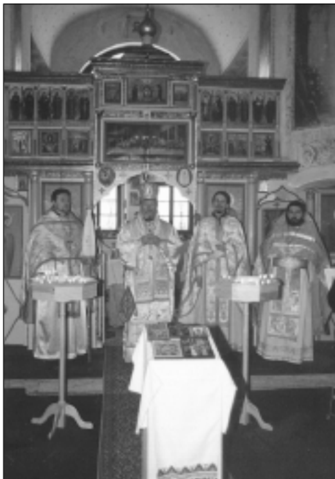
Archijerejská božská liturgie v chrámu sv. Jana Křtitele, Rumburk